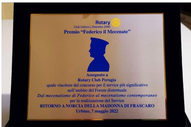
La targa Premio FEDERICO IL MECENATE

In ambito Rotary International Distretto 2090, inoltre, abbiamo istituito un concorso dal titolo "PREMIO FEDERICO IL MECENATE" . Un prestigioso premio da assegnare al progetto/service di intervento più significativo proprio sul mecenatismo , sia esso rivolto verso l'arte che verso la cultura in generale. La Commissione giudicante, composta dai delegati dei Rotary Club appartenenti al territorio della Terra del Duca (Gubbio, Novafeltria, Urbino, Pesaro e Senigallia), dal Governatore Gioacchino Minelli e dal Governatore entrante Paolo Signore, ha assegnato il Premio ai Rotary Club Perugia, Spoleto e Norcia per il Service Interclub RITORNO A NORCIA DELLA MADONNA DI FRASCARO .