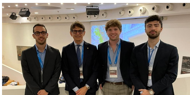
I ragazzi del Rotaract Valle del Metauro che ci hanno aiutato in segreteria

In sintesi, il lascito di Federico va ricordato con la funzione di stimolo per sviluppi socio-economici-culturali, che il Rotary Club Urbino non dimenticherà di certo!