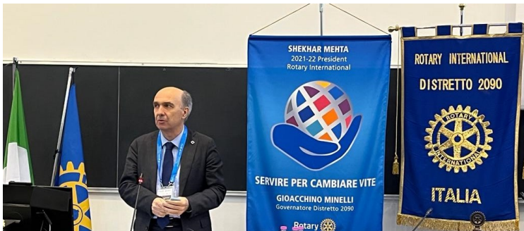
Il Magnifico Rettore Giorgio Calcagnini